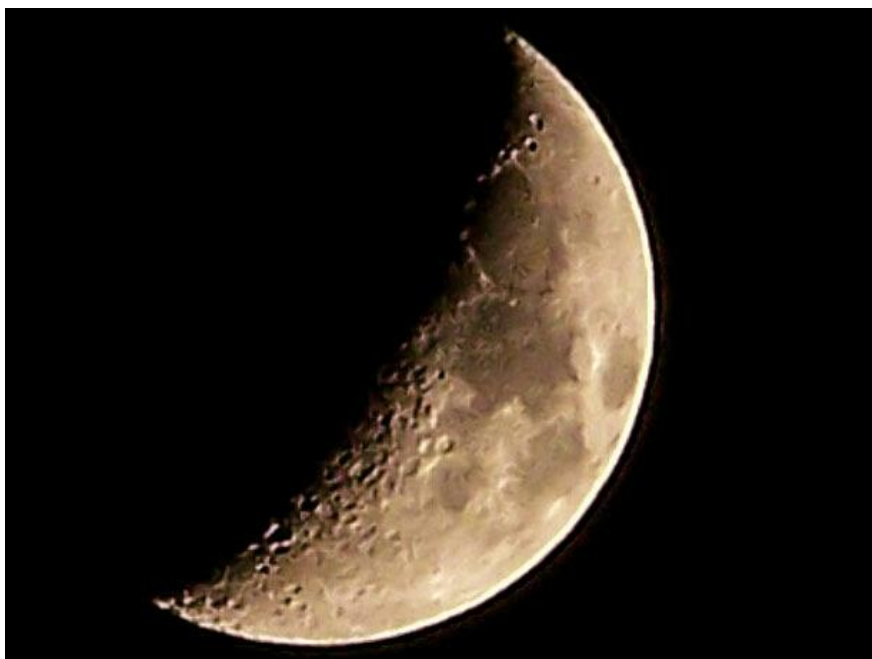
11月6日 18:43 的上弦月