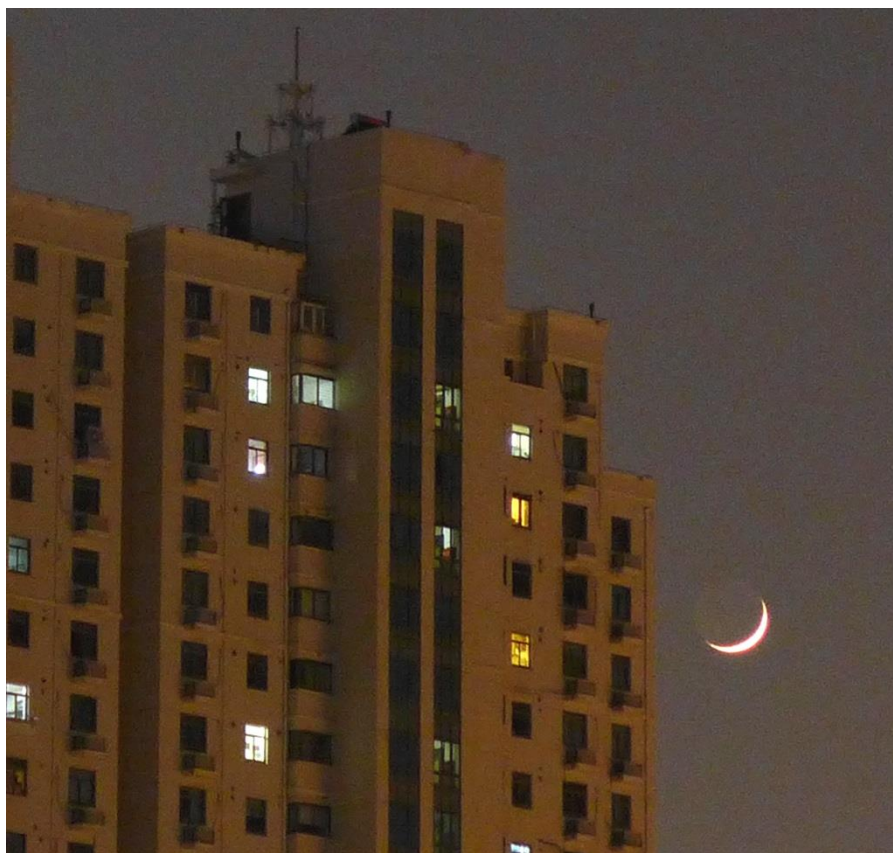
11 月 2 日 18:00 西边刚露面的娥眉月

一别故土数千载，嫦娥恋乡回步趋。 通亮冰镜秀真容，皎洁温柔美婵娟。 月色融融如秋水，玉轮当空世人赞。 秋月秋景秋色美，月宫嫦娥舞翩跹。 神舟天宫追月走，日出日落肩并肩。 待到来年登月时，伴舞嫦娥玉兔牵。 半空云层争赏月，恼煞众生直叹息。 遥望天宫巡天人，一览了然令人羨。 骤然云层四散开，洞见皎月露靛颜。 窥视芳容机莫失，忙按相机快门键。 明月月月挂苍穹，超级月亮实罕见。 再睹嫦娥特写照，下次须等十八年。