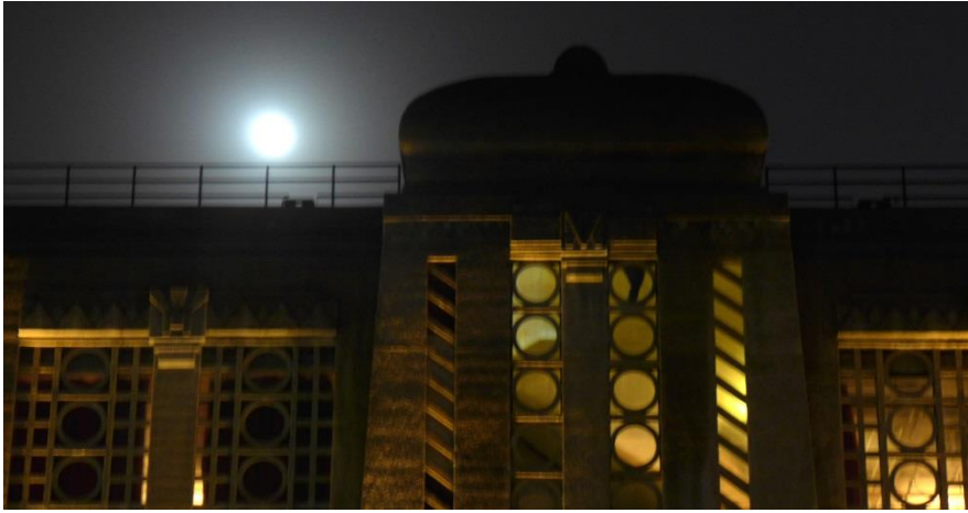
11月15日 19:57 "1933老场坊"正门