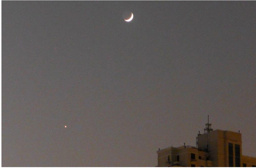
11月3日 17:54 西南面的娥眉月，照片左下方是金星。