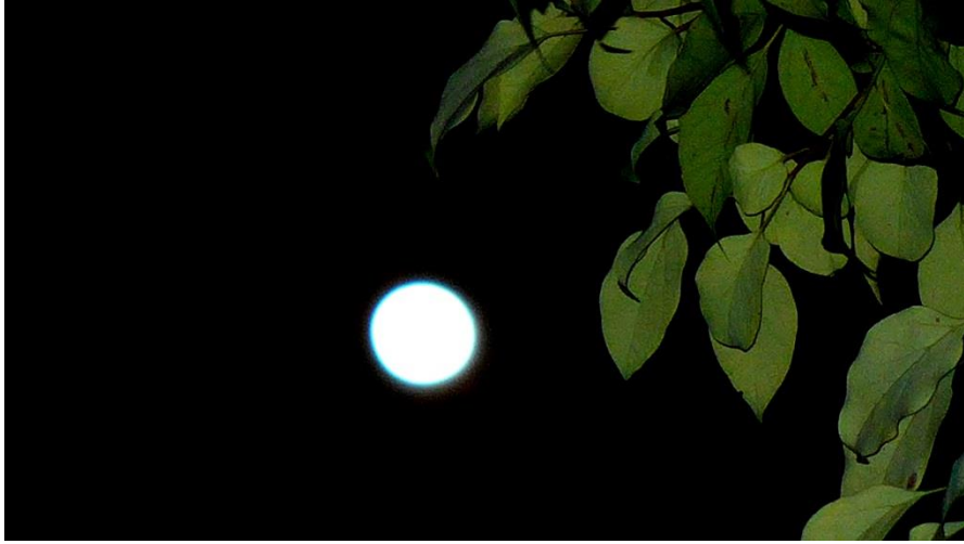
11月15日 19:49 居住小区内