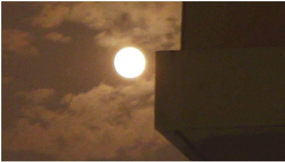
11月14日19:00云层中的超级月亮