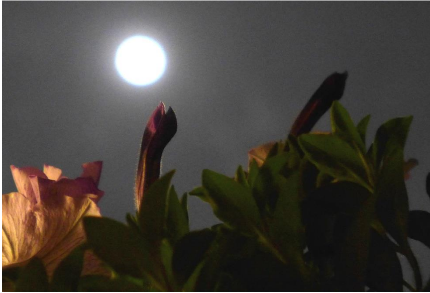
11月14日23:20“花好月圆”，阳台上顶空的超级月亮。