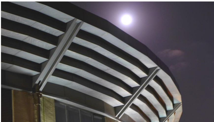
11月15日 20:14 "1933老场坊"二十四边形主楼