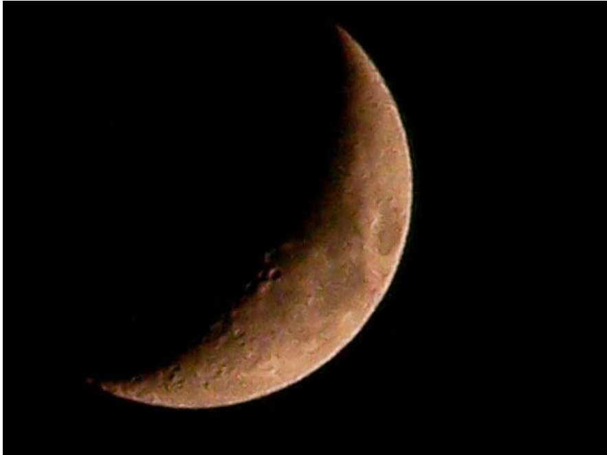
11月5日 17:42 的娥眉月