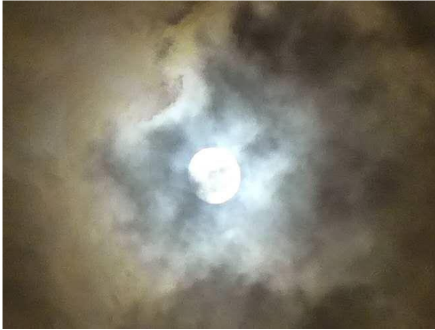
11月12日 19:03 彩云中的月亮