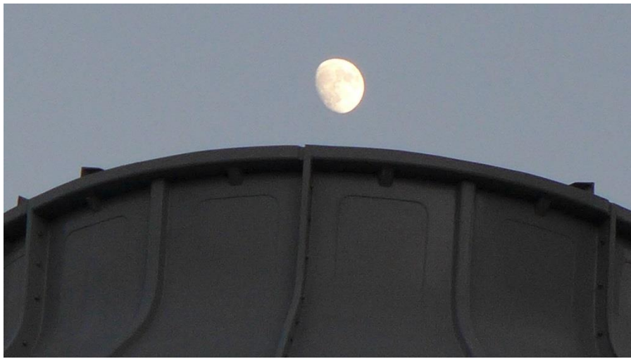
11月10日16:57“1933老场坊”屋顶上方的凸月